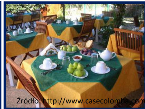
B&B Bagilo Case Colomba, Włochy

Więcej przykładów w The European Eco-label for tourist accommodation service na: http://www.turismdurabil.ro/literatura/cp/CP-in-Hotels/e_bat_EU_Eco-label-for-Tourist-Accommodation-Service.pdf