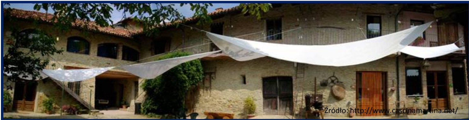
Agriturismo Cascina Martina, Włochy

Przykłady miejsc odznaczonych certyfikatem Ecolabel: